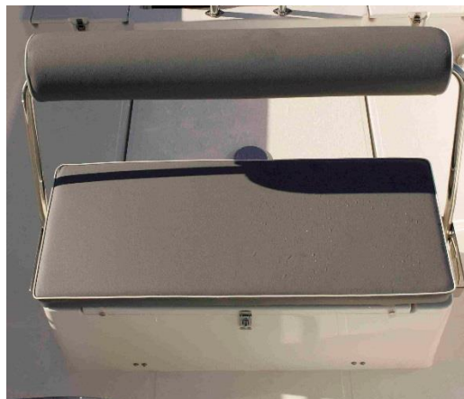
Standard Version Fahrersitz.